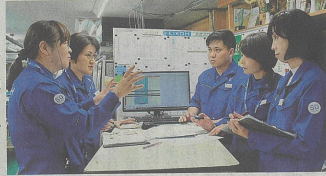
電源管理会議で生産スケジュールを調整する栄光製作所の各工程責任者