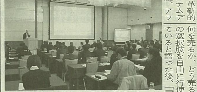
参加者は山井社長の講演に聞き入った

ぐんま産業創造倶楽部 は3日、10周年記念新春 セミナー「スノーピーク 流の価値作りとは」をラ シーネ新前橋(前橋市古 市町)で開いた。15年12 月に東証一部上場を果た した、アウトドア用品メ ーカー、スノーピークの 山井太社長が仕事論を語 るもので、約100人が 講演に聞き入った。