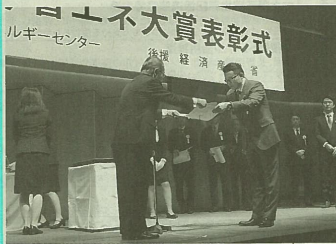
表彰を受ける勅使河原社長